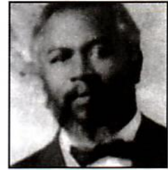
William J. Seymour