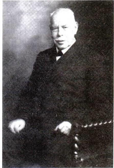
Ο Smith Wigglesworth 87 ετών

Σε κάποια περίπτωση ο Smith υποσχέθηκε σ' έναν νέο να πάει και να τον βοηθήσει όταν θα άρχιζε καινούργιο έργο σε μια νέα και δύσκολη περιοχή. Τον καιρό εκείνο διακονούσε με το γαμπρό και την κόρη του στις ακτές του Ειρηνικού. Άκουσε πως ο νέος αυτός βρισκόταν στις ακτές του Ατλαντικού και τον χρειάζοταν. Δεν δίστασε να πληρώσει από την τσέπη του 500 δολάρια για το εισιτήριο του τρένου και του πουλμάν και να πάει να τον βρει για να εκπληρώσει την υπόσχεση που του έκανε. Στην πρώτη συνάθροιση που έγινε το απόγευμα ήταν μόνο έξι άτομα (εκτός από την ομάδα του) σε μια αίθουσα που χωρούσε 5.000 άτομα. Η αρχή δεν ήταν τόσο ενθαρρυντική αλλά προτού τελειώσει η εκστρατεία η αίθουσα γέμισε και μια καινούργια εκκλησία άνοιξε τις πόρτες στην περιοχή εκείνη.