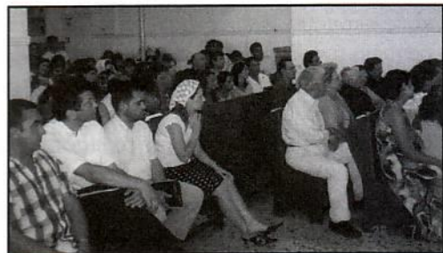
Μέρος του ακροατηρίου στην εκκλησία Χανίων