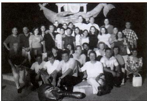
Στην παραλία του Ρεθύμνου με αδέρφια μας ντόπια

26 νέοι και νέες με 6 Ι.Χ. από διάφορα μέρη της Ελλάδας (Ξάνθη, Καβάλα, Δράμα, Σέρρες, Κατερίνη, Κοζάνη, Βάγια, Αθήνα) επισκεφτήκαμε από τις 22 μέχρι τις 26 Ιουλίου 2004, την Κρήτη.