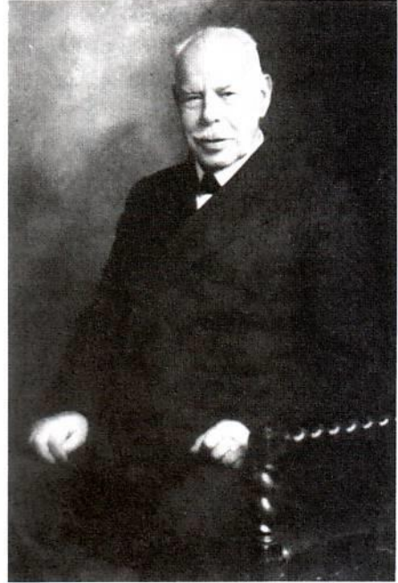
Ο Smith Wigglesworth 87 ετών