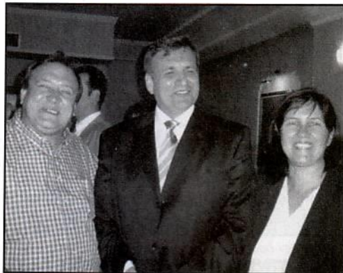
Ο Πρόεδρος Boris με τον Πρόεδρο Βίρκο και τη γυναίκα του