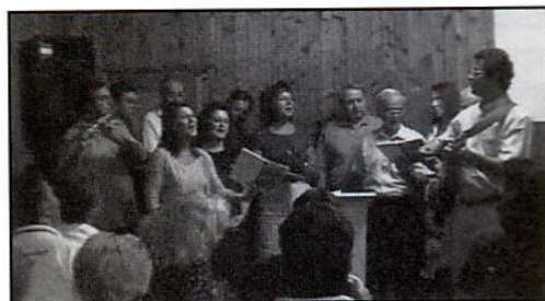
Στην εκκλησία του Κοράνοβο

8 γιατροί, 5 νοσοκόμες κι άλλα αδέρφια από Καβάλα, Δράμα, Σέρρες, Θεσσαλονίκη, Κατερίνη, Κοζάνη, Αλεξάνδρεια κι Αθήνα... Επισκεφθήκαμε την γειτονική μας πρώην Γιουγκοσλαβική Δημοκρατία Μακεδονία μ' ένα πούλμαν. Το πούλμαν ήταν φορτωμένο με φάρμακα, ρούχα, τρόφιμα για τους φτωχούς γείτονές μας, που χρόνια οι "πύλες" μας ήταν κλειστές και απροσπέλαστες.