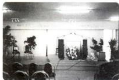
ΕΓΚΑΙΝΙΑ: Άποψη Αίθουσας, Σύναξη 2-7-89