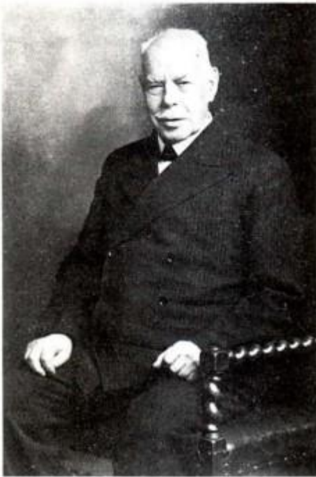
O Smith Wigglesworth to '87

του Πνεύματος. Αφηγείται ο ίδιος την ιστορία του: