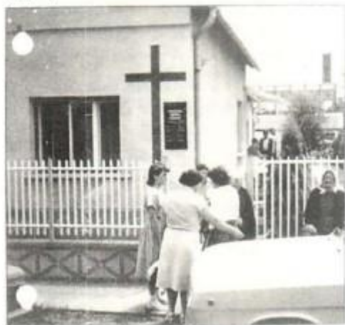
Εκκλησία της Πεντηκοστής στην Ουγγαρία

Μια από τις πιο απομονωμένες και καταπιεσμένες χώρες της Ευρώπης. Από το 1948 εκατοντάδες πιστοί μαρτύρησαν και φυλακίστηκαν για την πίστη τους στο Θεό. Η Αλβανία καυχείται ότι είναι η πρώτη αθεϊστική χώρα του κόσμου. Το 1967 κήρυξε παράνομες όλες τις θρησκείες και έκλεισε 2.169 εκκλησίες και τζαμιά. Σήμερα το 30% του πληθυσμού είναι Χριστιανοί. Πώς συμβαίνει αυτό; Μέσω του ραδιοφώνου. Δύο εκατομμύρια Αλβανών που ζούνε στα σύνορα της Γιουγκοσλαβίας και τρία εκατομμύρια που ζούνε μέσα στην Αλβανία ακούνε το σωτήριο μήνυμα του Ευαγγελίου μέσω του ραδιοφώνου. Προσεύχεσθε να χρίσει ο Κύριος τα μηνύματα αυτά με Πνεύμα Άγιο ώστε να σωθούν οι ψυχές που τα ακούνε. Προσεύχεσθε ιδιαίτερα για την ηγεσία της χώρας.