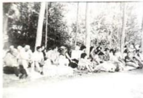
Λυδία - Καβάλας