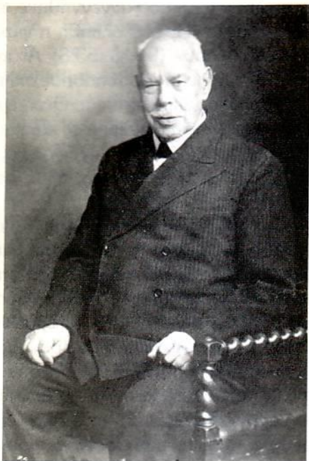
Ο Smith Wigglesworth 87 ετών

βδομάδα για ν' αγοράζει τα εργαλεία που χρειάζοταν στη δουλειά του. Μια μέρα, καθώς γυρνούσε στους δρόμους της πόλης, ανακάλυψε μια συνάθροιση πιστών όπου προσεύχονταν για τους αρρώστους και γίνονταν καλά. Από τότε άρχισε να στέλνει πολλούς αρρώστους στη συνάθροιση του Ληντς, με δικά του έξοδα, για να θεραπευτούν. Στην Πόλυ όμως δεν είπε τίποτα επειδή δεν ήξερε ποια στάση θα κρατούσε απέναντι σ' αυτό το «φανατισμό» όπως συνηθίζαν τότε να αποκαλούν τη θεία θεραπεία. Εκείνη όμως το ανακάλυψε και πήγε μαζί του στο Ληντς και θεραπεύτηκε. Από κείνη τη στιγμή η στάση της απέναντι στο «φανατισμό» αυτό ταυτίστηκε με κείνη του άντρα της.