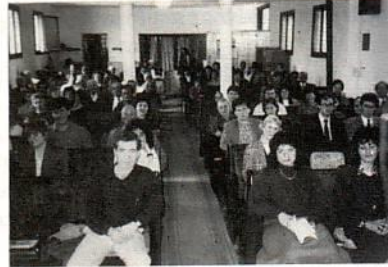
Κυριακή - 2η μέρα του συνεδρίου

Πεντηκοστής Κατερίνης, στην υπηρεσία άλλων αδελφών, που ήρθαν από όλη την Ελλάδα για να πάρουν μέρος στο συνέδριο αυτό. Βλέποντας τους αδελφούς μας να ευλογούνται, νιώσαμε χαρά και ενθάρρυνση να γεμίζει τις δικές μας καρδιές. Ακούστηκαν ομολογίες από νεαρές καρδιές, που σκόρπισαν το άρωμα της παρουσίας του Κυρίου με τα λόγια τους και μας έκαναν να νιώσουμε αυτό που λέει ο Λόγος του Θεού: «Τι καλό και τι τερπνό να κατοικούν οι αδελφοί εν ομονοία». Η αλήθεια αυτή επαληθεύτηκε και μάλιστα, τη φορά αυτή, με ένα ιδιαίτερο τρόπο, βαπτίζοντας δυο αδελφία μας με Πνεύμα Άγιο και αγγίζοντας πολλούς με την παρουσία Του.