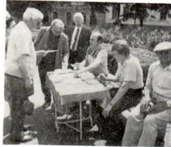
Χριστιανική βιβλιοθήκη στο Chernniutsi της Ουκρανίας

Τον περασμένο χρόνο επισκέφθηκα την Ασόρια της Νέας Υόρκης με τους 300.000 Έλληνές της. Ήταν η τρίτη επίσκεψή μου αυτή. Τη μέρα που σχεδίαζα να φύγω αισθάνθηκα να παρατείνω την επίσκεψή μου για μία ακόμη μέρα. Στις 10 π.μ. της μέρας αυτής συναντήθηκα με το διευθυντή της Ελληνικής Ραδιοφωνίας της Αμερικής. Αποτέλεσμα να μου προσφερθεί ώρα στο ραδιόφωνο για εκπομπές. Λίγο αργότερα ο υπεύθυνος των Αποστολικών Εκκλησιών Πεντηκοστής της περιοχής ενέκρινε την άδεια για να ανοιχθεί Ελληνική εκκλησία Πεντηκοστής στη Νέα Υόρκη. Στις 2 μ.μ. της ίδιας μέρας βρισκόμουν στο γραφείο του Διεθνούς Ελληνικού Τηλεοπτικού Δικτύου και με παραχωρούσε ώρα για να κηρύττω στους Έλληνες από την τηλεόραση. Στις 7 Απριλίου πραγματοποιήθηκε η πρώτη εκπομπή. 1 εκατομμύριο Έλληνες της Αμερικής, του Καναδά και των Καραβαϊκών νησιών άκουγαν το Ευαγγέλιο στη μητρική τους γλώσσα. Προσεύχομαι μέσα στη Δεκαετία του Θερισμού να ανοίξει ο Θεός πόρτες για να ευαγγελιστούν τα 3 εκατομμύρια των Ελλήνων που βρίσκονται στα Βόρεια μέρη της Αμερικής. Προσεύχεσθε κι εσείς για το σκοπό αυτό. Είναι η ώρα να ζητήσουν οι Έλληνες μία φορά ακόμη «να δουν τον Ιησού» (Ιωάν. 12:21).