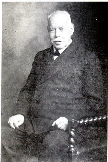
O Smith Wigglesworth 87 ετών

να κάνει για την κατάστασή του. Ξέσπασε σε κλάματα και πήγε να φωνάζει το γιατρό – όχι για να με βοηθήσει, γιατί στην κατάσταση που ήμουν δε μπορούσε κανένας να με βοηθήσει εκτός απ' το Θεό, αλλά για να διαπιστώσει το τέλος μου.