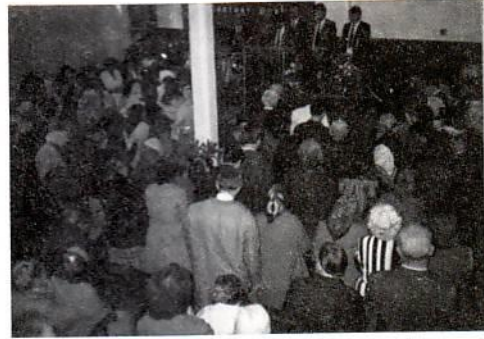
Δεύτερη επίσκεψη στη Βουλγαρία