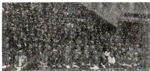
Εκπρόσωποι εκκλησιών στο πρώτο συνέδριο της Μόσχας με σκοπό τη σύσταση αδελφότητας.