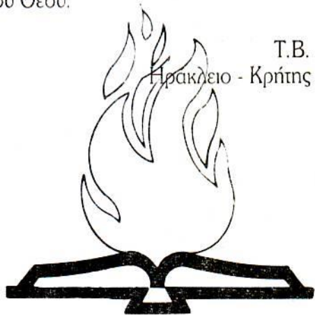
T.B. Ηρακλείο - Κρήτης

Έτσι βλέπουμε ότι η Αγία Γραφή είναι πράγματι θεόπνευστη. Αναφέρει με ακρίβεια πράγματα που πολύ αργότερα ανακαλύφθηκαν από επιστήμονες. Μάλιστα τα αναφέρει σε μια εποχή που υπήρχαν πολλές λανθασμένες απόψεις και προκαταλήψεις. Η Βίβλος είναι ο Λόγος του Θεού.