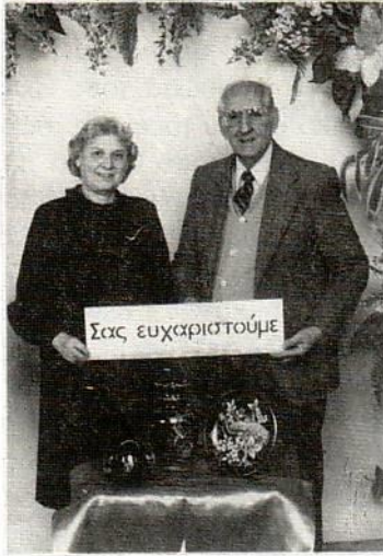
Ένα ενθύμιο αγάπης εκ μέρους της Συνόδου.