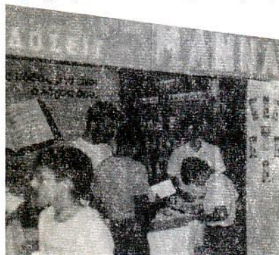
Διεθνής Έκθεση Θεσσαλονίκης Περίπτερο «ΜΑΝΑ»

Η επόμενη σελίδα της βιογραφίας μας θ' ανοίξει και θα κλείσει με τους αγώνες μας πάλι για την Ελλάδα σε διαφορετικό όμως πεδίο δράσης, την Αμερική. Ζητάμε τις προσευχές σας στη νέα διακονία μας που θ' αρχίσει μετά τον Ιούνιο.