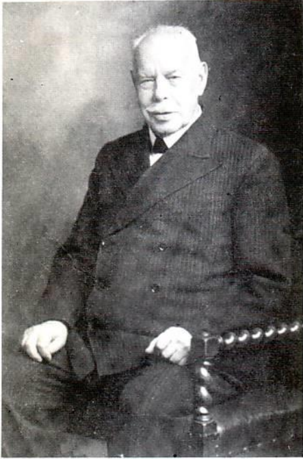
Ο Smith Wigglesworth 87 ετών

Η παρουσία μου έφερε τις καρδιές τριών ανθρώπων σε κατάνυξη και, πριν βγω απ' την πόρτα, σώθηκαν κι οι τρεις! Βγήκα απ' το μπακάλικο και συνέχισα τη βόλτα μου. Είδα δυο γυναίκες να περπατάν σ' ένα λιβάδι με κουβάδες στα χέρια. «Είστε σωσμένες;» φώναξα. Την ίδια στιγμή, ήρθε η καρδιά τους σε κατάνυξη, έφυγαν οι κουβάδες απ' τα χέρια τους κι άρχισαν να προσεύχονται. Μέσα σ' εκείνο το λιβάδι ο Κύριος τις έσωσε.