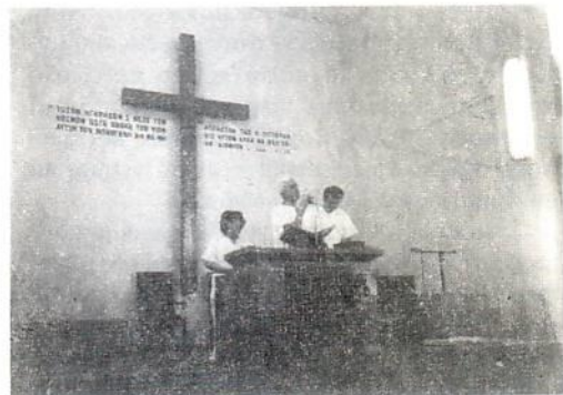
«Βάπτισμα εν ύδατι»