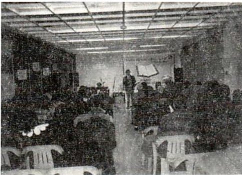
Από την εξόρμηση στη Λάρισα

«Έλα να ηρεμήσεις» ήταν το μήνυμα της πρόσκλησης που μοίραζαν οι νέοι μας από νωρίς το πρωί του Σαββάτου στις 14 Μαρτίου για τη συγκέντρωση που θα γινόταν στο ξενοδοχείο Ντιβάνι Παλλάς της πόλης. Οι νέοι των εκκλησιών μας οργάνωσαν μια χαρούμενη, απλή και πολύ ενδιαφέρουσα πνευματική εκδήλωση που πλαισιωνόταν από ύμνους, ζωντανές εμπειρίες απελευθέρωσης από τα ναρκωτικά και ένα πολύ επίκαιρο μήνυμα με τίτλο «Πώς βλέπουμε το μέλλον;» Το όλο πρόγραμμα ξεκούρασε ψυχικά