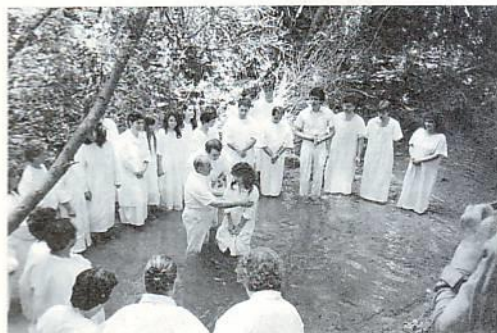
Βάπτισμα στο ποτάμι Λυδίας

Ευχαριστούμε το Θεό που ευλόγησε και φέτος την επίσημη συνάντησή μας στο γραφικό ποτάμι της Λυδίας. Αδέρφια από διάφορα μέρη της Ελλάδας και κυρίως από την Μακεδονία μαζευτήκαμε με σκοπό να λατρεύσουμε τον Θεό και να χαρούμε ο ένας την συντροφιά του άλλου. «Ίδού, τι καλόν και τι τερπνόν, να συγκατοικήσιν εν ομοιοία οι αδελφοί» (Ψαλμός ρλγ' 1).