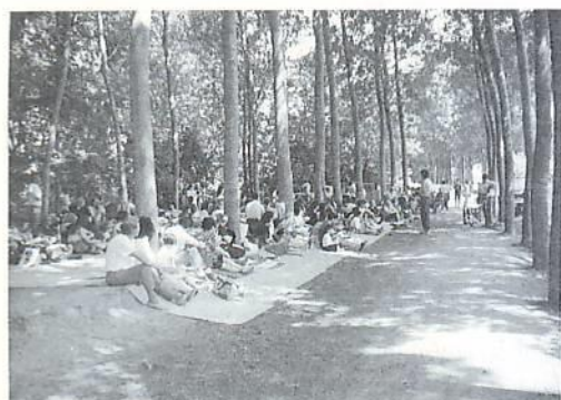
Λατρεία στο Θεό κοντά στο ποτάμι

Ξεκινήσαμε την ημέρα μας με προσευχή, δοξολογία, υμνωδία και λατρεία προς τον Κύριο. Ο τόπος γέμισε από ύμνους και ψαλμούς που δόξαζαν τον αιώνιο Θεό.