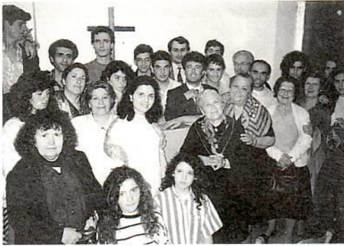
Στη νέα Εκκλησία του Ρεθύμνου