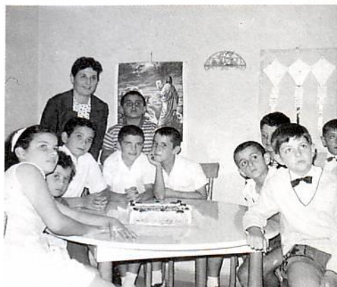
Κυριακό Σχολείο εκκλησίας Θεσσαλονίκης 1965

«Αφήσατε τα παιδιά να έρχονται προς εμέ και μη εμποδίζετε αυτά διότι των τοιούτων είναι η βασιλεία του Θεού» (Λουκ. 18:16).