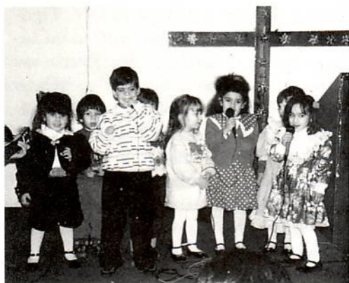
Κυριακό Σχολείο εκκλησίας Ρόδου