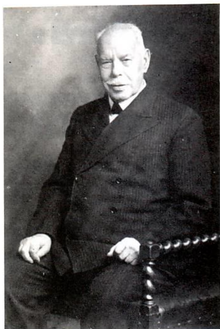
Ο Smith Wigglesworth 87 ετών

πως σε λίγο θα γινόταν κάτι το τελείως διαφορετικό στη ζωή μου. «Όταν βάλω τα χέρια μου πάνω σου, η δόξα του Κυρίου θα γεμίσει το δωμάτιο και δε θα μπορώ να σταθώ στα πόδια μου. Θα πέσω κάτω». Βγήκα έπειτα από το δωμάτιο να πάρω τα ρούχα του και είπα σ' έναν απ' την οικογένεια να του φορέσουν κάλτσες.