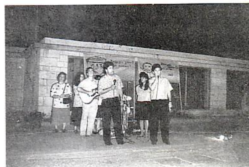
Υπαιθρια ομιλία στο Ρέθυμνο

μολογίες και μηνύματα από τον Λόγο του Θεού. Συγχρόνως μοιράστηκαν στον κόσμο εκατοντάδες φυλλάδια με ευαγγελιστικά μηνύματα. Η παρουσία των τριών πανώ στα οποία υπήρχαν γραμμένα μηνύματα σωτηρίας, ελπίδας και ζωής μαζί με τα μουσικά όργανα τόνιζαν την παρουσία της ομάδας μας. Εδώ πρέπει να τονίσουμε την θετική στάση του κόσμου στο έργο μας. Επίσης οι συναθροίσεις που είχαμε με την τοπική αδελφική εκκλησία ήταν ευλογημένες και εποικοδομητικές για όλους. Αξίζει να ξεχωρίσουμε την επίσκεψή μας και το ευαγγελιστικό πρόγραμμα που δώσαμε στην φυλακή της Αγίας Χανίων, όπου μπροστά σ' ένα μεγάλο ακροατήριο φυλακισμένων και προσωπικού της φυλακής μιλήσαμε για τον Χριστό, με τραγούδια, ομολογίες και κατάλληλα μηνύματα από την Γραφή. Πραγματικά η επικοινωνία μας με τους κρατούμενους ήταν πολύ ευλογημένη γιατί τους δώσαμε χαρά και ελπίδα με το πρόγραμμά μας και την αγάπη που τους δείξαμε. Τονίζουμε εδώ την ύπαρξη μέσα στην φυλακή τριών αδελφών που είναι κρατούμενοι και εργάζονται για τον Χριστό μεταξύ των υπολοίπων φυλακισμένων.