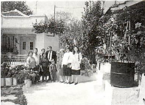
Επίσκεψη στην αρχαία Πέλλα