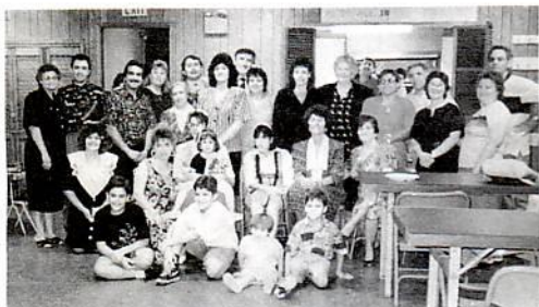
Κοινό τραπέζι με την Εκκλησία της Ν. Υόρκης