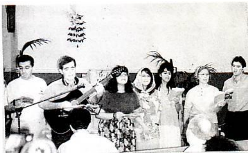
Στην εκκλησία Χανίων

Η αρχή έγινε από την πόλη των Χανίων όπου με την συνεργασία και βοήθεια των νέων της εκεί τοπικής αδελφικής εκκλησίας φέραμε το μήνυμα του Ευαγγελίου του Χριστού στην παραλία και στην πιο Κεντρική πλατεία της πόλης, με χριστιανικά τραγούδια, προσωπικές ο-