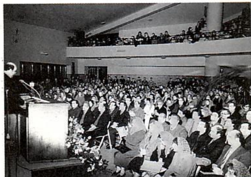
Εκκλησία της Messina

Σ' όλες τις Εκκλησίες δεν περιγράφεται η αγάπη, η αφοσίωση προς τον Κύριο και η συμπάθεια κι αγάπη προς τις Ελληνικές μας Εκκλησίες. Για β' φορά χωρίς να «ερεθίζω» τα φιλότι-