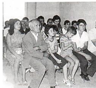
Εκκλησία Σεβαστής τότε.