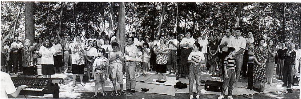
Λατρεία - βάπτισμα στο ποτάμι της Λυδίας Καβάλας.