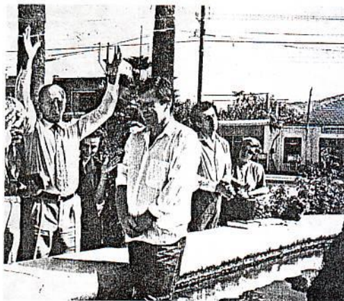
Ο Υ.Β. βαπτίζεται έξω από την φυλακή Χανίων.

Στη διάρκεια των ετών που ο Υβ αλληλογραφούσε και επικοινωνούσε με τους αδελφούς άκουσε για το βάπτισμα στο νερό. Η επιθυμία του ήταν να βαπτιστεί στη Νίκαια με την ελευθερία Του. Επειδή αυτό όμως στάθηκε αδύνατο τελικά