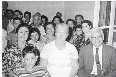
Β' Αποστολική Εκκλησία Πεντηκοστής.

Εν τω μεταξύ οι αδελφοί είδαν την ανάγκη διδακτικής ύλης στα Κυριακά Σχολεία και επιδόθηκαν στη μετάφραση και εκτύπωση βιβλίων Κυριακού Σχολείου για παιδιά ηλικίας 8-10 και 11-13 ετών.