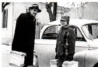
Πατέρας και υίος στο έργο το τέρο

Από το 1978-1987 υπηρέτησαν στην παιδική κατασκήνωση, Βηθανία, στο Πόρτο Ράφτη . Η διδασκαλία τους, τα πνευματικά τους προγράμματα και η ζωή τους έδωσε στην κατασκήνωση την έννοια ότι είναι το μέρος που τα παιδιά θα συναντήσουν τον Χριστό για προσωπικό τους Σωτήρα όταν θα 'ρθουν να περάσουν τις καλοκαιρινές τους διακοπές. «Η κατασκήνωση ήταν τότε πνευματική» είπε μια μητέρα ενός παιδιού, «κι αυτό είναι που θέλουμε εμείς οι γονείς».