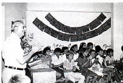
Υμνοδία στην κατασκηνοση παιδιών.

Από το 1978-1987 υπηρέτησαν στην παιδική κατασκήνωση, Βηθανία, στο Πόρτο Ράφτη . Η διδασκαλία τους, τα πνευματικά τους προγράμματα και η ζωή τους έδωσε στην κατασκήνωση την έννοια ότι είναι το μέρος που τα παιδιά θα συναντήσουν τον Χριστό για προσωπικό τους Σωτήρα όταν θα 'ρθουν να περάσουν τις καλοκαιρινές τους διακοπές. «Η κατασκήνωση ήταν τότε πνευματική» είπε μια μητέρα ενός παιδιού, «κι αυτό είναι που θέλουμε εμείς οι γονείς».