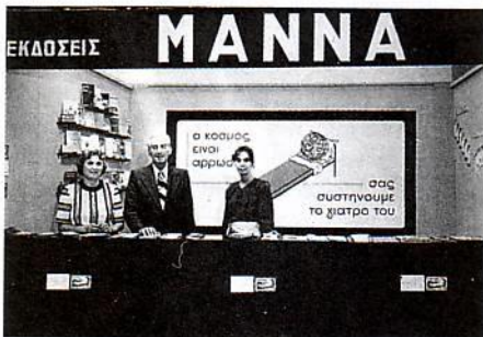
Στη Διεθνή Έκθεση Θεσ/νίκης.