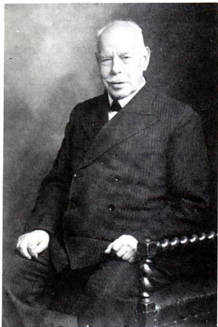
Ο Smith Wigglesworth 87 ετών

Μια άλλη περίπτωση ήταν αυτή, ενός νέου που περπατούσε κυρτωμένος, σαν εκείνη της γυναίκας στη Γραφή που ο Ιησούς είπε πως κατεχόταν από το πονηρό πνεύμα της ασθένειας. Τη μέρα κείνη ο νέος αυτός ελευθερώθηκε όπως είχε ελευθερωθεί και κείνη η γυναίκα στη συναγωγή. Ο Χριστός είπε πως εργαζόταν τα έργα του Πατέρα Του και αυτός που πίστευε θα έκανε τα ίδια έργα μ' Εκείνον. Εκείνος επιπίμψε το πνεύμα της ασθένειας στη γυναίκα, κι εγώ έκανα το ίδιο στο όνομα του Ιησού. Ο νέος έγινε αμέσως καλά κι όλοι δόξασαν τον Κύριο για το θαύμα που είδαν να γίνεται μπροστά στα μάτια τους.