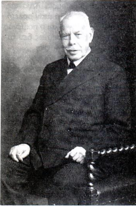
Ο Smith Wigglesworth 87 ετών

προσπάθειά της να ξεφύγει απ' τα χέρια τους.