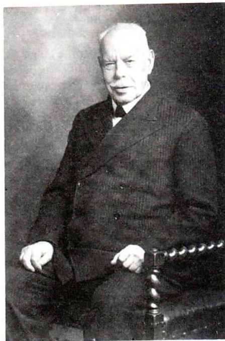
Ο Smith Wigglesworth 87 ετών