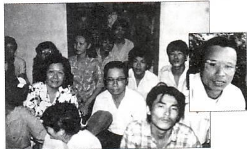
Αποφυλακισμένοι Βιετναμέζοι ευαγγελίζουν δυναμικά την πατρίδα τους.

Οι πιο δυναμικοί και τολμηροί ευαγγελιστές στο Βιετνάμ είναι οι πρώην φυλακισμένοι. Ο αδελφός του, στη μικρή φωτογραφία, φυλακίστηκε για την πίστη του στον Κύριο. Η ζωή του και η μαρτυρία του στη φυλακή ελευθέρωσε πολλές ψυχές από τα δεσμά της αμαρτίας και από τα κάγκελα της φυλακής. Σήμερα το Βιετνάμ ευαγγελίζεται κατά μέγα μέρος από τους πρώην κατάδικους.