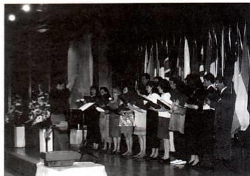
Η Χορωδία του Ν. Ψυχικού ψάλλει