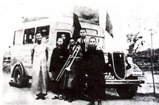
Το λεωφορείο που γινόταν κινητός άμβωνας για να μεταφέρει τα Καλά Νέα

άφησε ιστορία και παράδειγμα προς μίμηση σε όσους τον γνώρισαν.