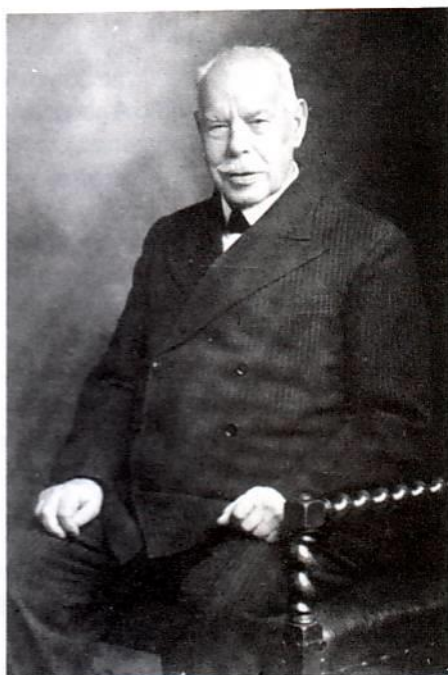
Ο Smith Wigglesworth 87 ετών

Σ την ίδια συνάντηση ήταν μια ακόμη γυναίκα που της είπε να "τρέξει" αλλά δίστασε. Αναγκάστηκε να τη σπρώξει για να ξεκινήσει, αλλά αρπάχθηκε από πάνω του κι άρχισαν να τρέχουν μαζί γύρω απ' την αίθουσα. Η γυναίκα αυτή υπέφερε από ισχυαλγία και με το ζόρι κουνούσε τα πόδια της. Μέχρι την ημέρα εκείνη, που ο Θεός τη θεράπευσε και από τότε πήγαινε στις συναντήσεις περπατώντας αντί να πάρει το λεωφορείο. Της έδινε χαρά το ότι μπορούσε να χρησιμοποιεί τα ποδια της.