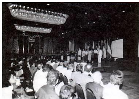
Η Χορωδία Αθηνών ψάλλει