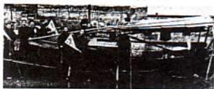
Ένα από τα πλοία που μετέφερε τα Καλά Νέα

Ευαγγελίου που ορθοτομούσαν το Λόγο του Θεού. Αναγκάστηκε να ιδρύσει μια Θεολογική Σχολή που θα κατάρτιζε γνήσιους κήρυκες του Ευαγγελίου.