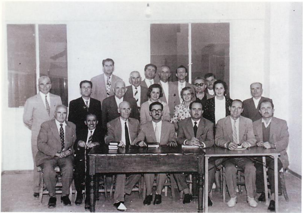
Σύνοδος της Αποστολικής Εκκλησίας Πεντηκοστής το 1960