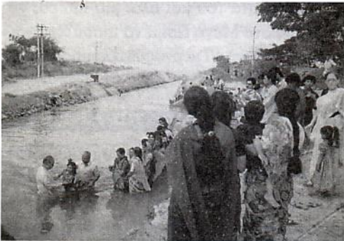
45 Ινδοί Τσιγγάνοι βαπτίζονται στο νερό

Χάρη στη δραστήρια διακονία του αδελφού Le Cossec ο αριθμός των αναγεννημένων Τσιγγάνων ανά τον κόσμο ανέρχεται στις 600.000. Οι 500.000 βρίσκονται στην Ευρώπη και οι υπόλοιπες 100.000 είναι διασκορπισμένες σε όλες τις ηπείρους της γης. Ο Θεός εργάζεται με θαυμαστούς τρόπους ανάμεσά τους. Διεγείρει στελέχη που θα φέρουν μήνυμα της σωτηρίας του Χριστού στους ίδιους τους πατριώτες τους.