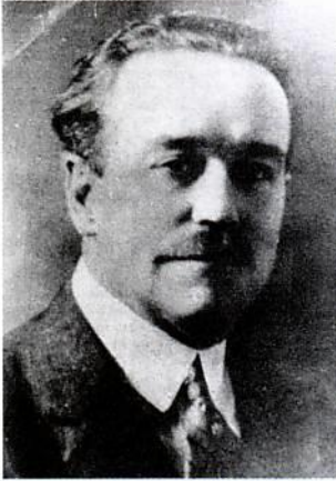
Κάρολος, το όργανο που χρησιμοποίησε ο Θεός στην αναζωπύρωση του Κάνσας της Αμερικής.

Μια καινούργια χλιετηρίδα σε λίγο θα ανατείλλει στον ορίζοντα. Ένας καινούργιος αιώνας με πολλές ελπίδες, καινούργιες επιτεύξεις, αναρίθμητες ευκαιρίες θα κάνει την εμφάνισή του στο ημερολόγιο του χρόνου. Για την εκκλησία όμως