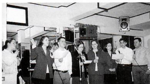
Η νεολαία των Βαγιών ψάλλει.

Το θέμα ήταν: Ο αγιασμός στη ζωή του πιστού. Τη διοργάνωση του Συνεδρίου είχε