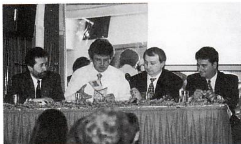
Στρογγυλό Τραπέζι ομιλητών συνεδρίου

κας, «Εξουσία Θεού-δύναμη των σκοτεινών δυνάμεων». Ηλ. Χ'Ελευθερίου, «Πώς θα νικήσουμε τις σκοτεινές δυνάμεις».