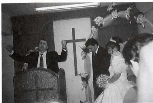
Τελετή γάμου στις Σέρρες

Στις Σέρρες ήδη η εκκλησία έλαβε άδεια από το Υπουργείο και άρχισε να τελει νόμιμα γάμους, αφιερώσεις κ.τ.λ.