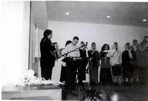
Νεολαία Καβάλας ψάλλει σε εγκαίνια εκκλησίας στη Βουλγαρία.