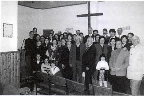
Αδέλφια νομού Δράμας και Καβάλας

Και στο νομό Σερρών και στο νομό Δράμας έχουμε αγαπτά αδέρφια που αγωνίζονται μ' αγάπη προς τον Κύριο. Η εκκλησία Καβάλας ποιμαίνει την εκκλησία Σερρών και το νέο έργο στη Δράμα. Τα ενοίκια της αίθουσας στη Δράμα (περισσότερο από 70.000 δρχ. με κοινόχρηστα) τα πλήρωνε κάθε μήνα η Εκκλησία Καβάλας. Πιστεύουμε ότι «ο Κύριος έχει λαόν πολύν εις την πόλιν ταύτην», Πράξεις ΙΗ' 10.